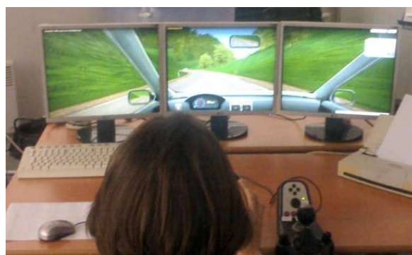
Vue générale de l'outil